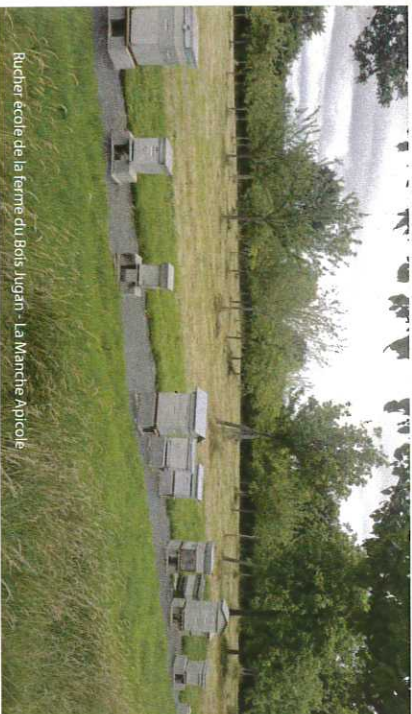
Bucher école de la ferme du Bois Jugan - La Manche Apicole

Le plan départemental de lutte collective a défini que seuls les nids à enjeux collectifs, c'est-à-dire avec une incidence apicole et/ou de santé sécurité/publique pourront, être détruits dans le cadre du programme, et à condition que la commune ait signé la convention de lutte collective.