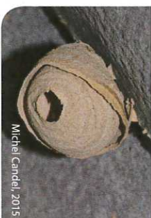
Michel Candell, 2015