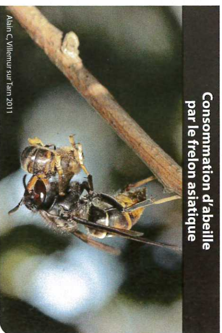
Alain C. Willemer sur Tam 2011